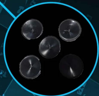
5 removable suction cups